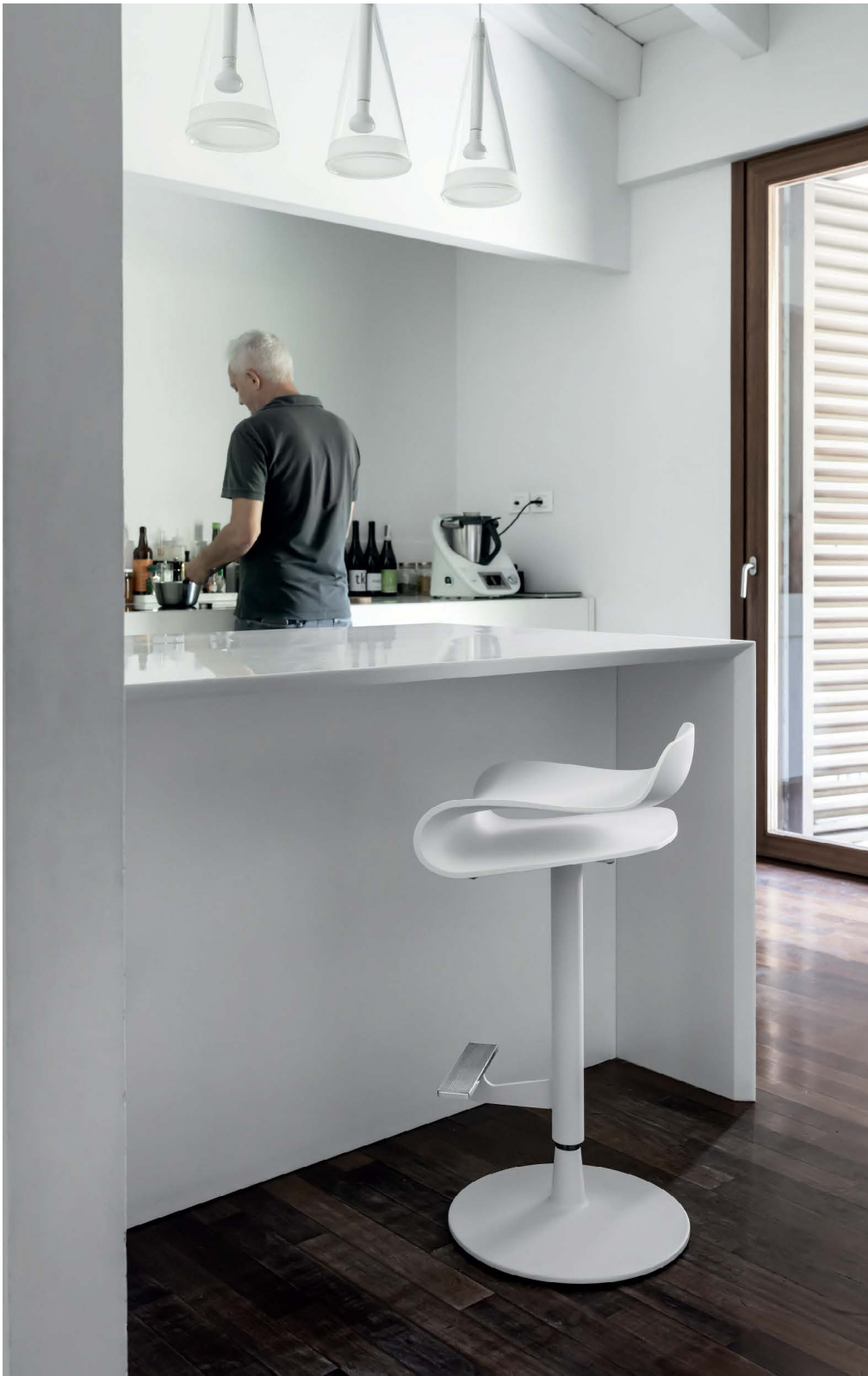
BCN stool - height adjustment PBT-plastic seat