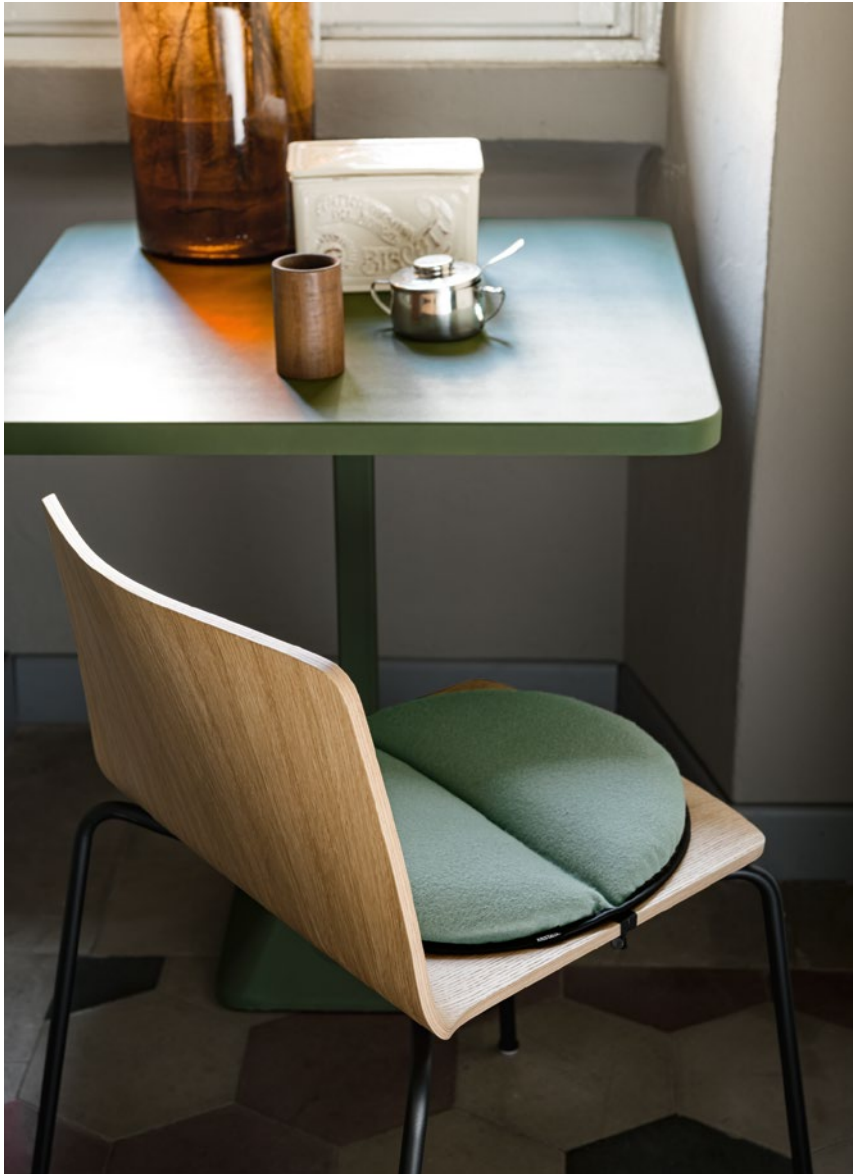
Lips—R removable cushion Upholstered Hero fabric