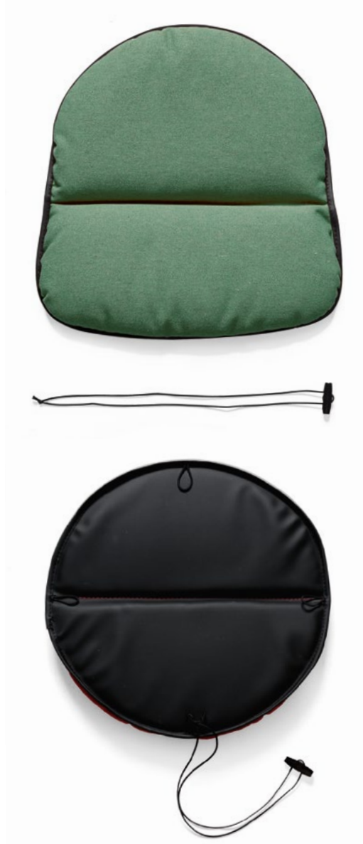
Lips—S removable cushion Upholstered Field 2 fabric