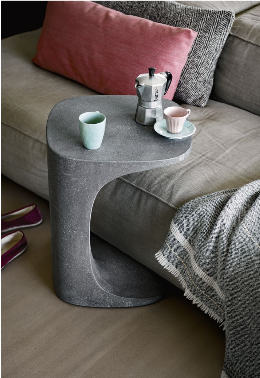
Font occasional table Cement